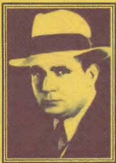
Роберт Ирвин Говард (1906 — 1936)

Великий Мастер фэнтези, создатель знаменитой «Саги о Конане» и автор более трехсот фантастических, мистических и приключенческих романов, повестей и рассказов.